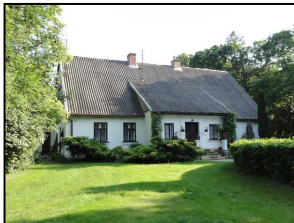
fot. 12. Dwór w Zawadzie Nowej

Z dawnego zespołu dworsko-parkowego w Zawadzie Nowej zachowany jest dwór, budynek gospodarczy oraz pozostałości parku. Z dawnej kompozycji czytelne są liniowe graniczne nasadzenia drzew oraz elementy wewnętrznego rozplanowania. Założenie wymaga rewaloryzacji z uwzględnieniem dawnej kompozycji związanej z dworem Podkulińskich, w oparciu o specjalistyczną dokumentację projektową, zgodnie z przepisami odrębnymi w zakresie ochrony zabytków.