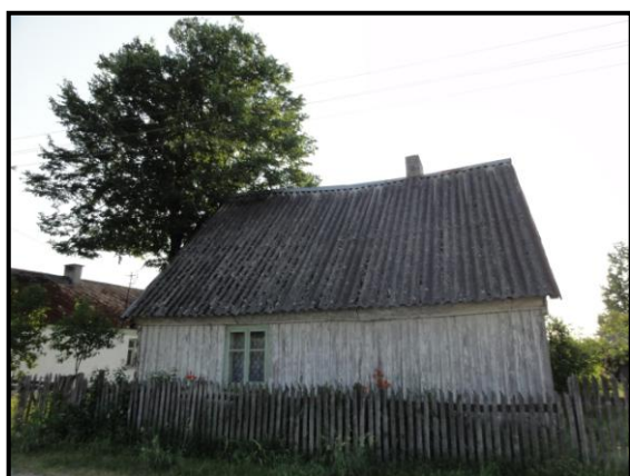
fot. 6. Dom drewniany w Oknach