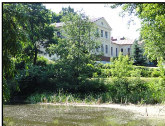
fot. 1. Dwór w Baruchowie – siedziba Urzędu Gminy

Z dawnego założenia dworsko-parkowego w Baruchowie zachowany jest dwór murowany, będący obecnie siedzibą Urzędu Gminy Baruchowo, stajnia murowana (obecnie rozebrana) oraz park z zachowanym układem wodnym i licznym, bogatym gatunkowo starodrzewem. Układ kompozycyjny założenia jest czytelny w podstawowych elementach dawnego rozplanowania dostosowanego do konfiguracji terenu, z zachowaną drogą dojazdową zlokalizowaną na osi dworu, obsadzoną alejowo podwójnym szpalerem lip. Część frontowa założenia jest porządkowana na bieżąco, niemniej przypadkowe nasadzenia w istotny sposób zniekształcają dawny podjazd. Park jest zaniedbany, o kompozycji zniekształconej ubytkami drzewostanu i niekontrolowanym rozwojem samosiewu drzew i krzewów. Założenie wymaga rewaloryzacji z wyeksponowaniem wszystkich zachowanych elementów oraz z odtworzeniem udokumentowanych relikwów dawnej kompozycji, w oparciu o specjalistyczną dokumentację projektową, zgodnie z przepisami odrębnymi w zakresie ochrony zabytków.