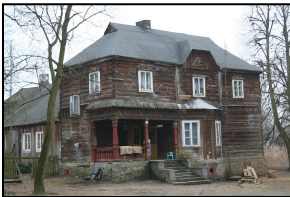
fot. 2. Dwór drewniany w Czarnem