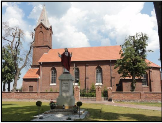
fot. 4. Kościół parafialny pw. Św. Trójcy wraz z figurą Chrystusa