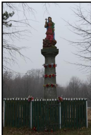
fot. 8. Figura św. Tekli w Kurowie