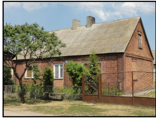
fot. 5. Dom murowany w Kłótnie