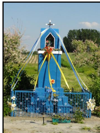
fot. 9. Kapliczka z figurą Matki Boskiej w Kurowie Kolonii