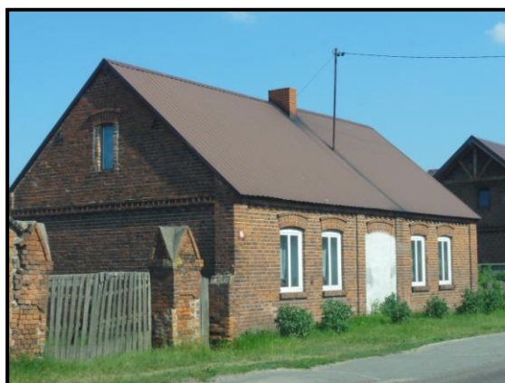
fot. 10. Dom murowany w Świątkowicach