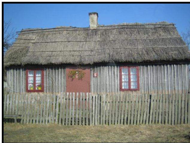
fot. 3. Dom drewniany w Gorenium Nowym (źródło własne)