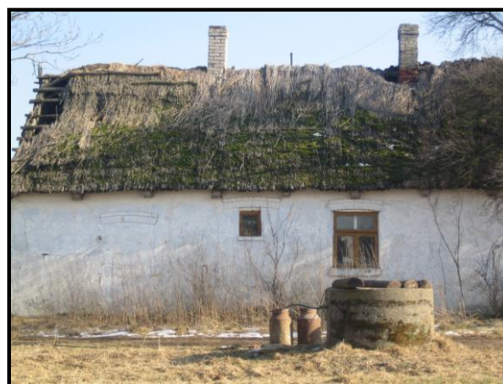
fot. 11. Dom w Zakrzewie Parcele