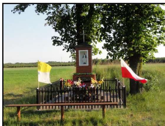
fot. 7. Kapliczka z figurką Matki Boskiej w Oknach