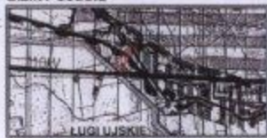
WYRYS ŁUGI UJSKIE skala 1:25 000

STUDIUM UMARUNKOWAŃ I KIERUNKÓW ZAGOSPODAROWANIA PRZESTRZENNEGO GMINY UJŚCIE