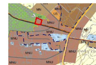
WYRYS ZE STUDIUM UWARUNKOWAŃ I KIERUNKÓW ZAGOSPODAROWANIA PRZESTRZENNEGO MIASTA I GMINY OBORNIKI skala 1:10 000

Załącznik nr 1 do Uchwały Nr II/30/18 Rady Miejskiej w Obornikach z dnia 10 grudnia 2018r. ogłoszonej w Dz. Urz. Woj. Wlkp. z dnia _____ poz. _____