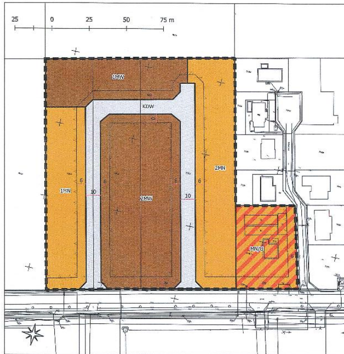
WYRYS ZE STUDIUM UWARUNKOWAŃ I KIERUNKÓW ZAGOSPODAROWANIA PRZESTRZENNEGO GMINY CZEMPINIŃ

Załącznik do Uchwały Nr LIV/197/2022 Rady Miejskiej w Czempiniu z dnia 28.09.2022 r. (Dz. Urz. Woj. Wielkopolskiego, poz.....)