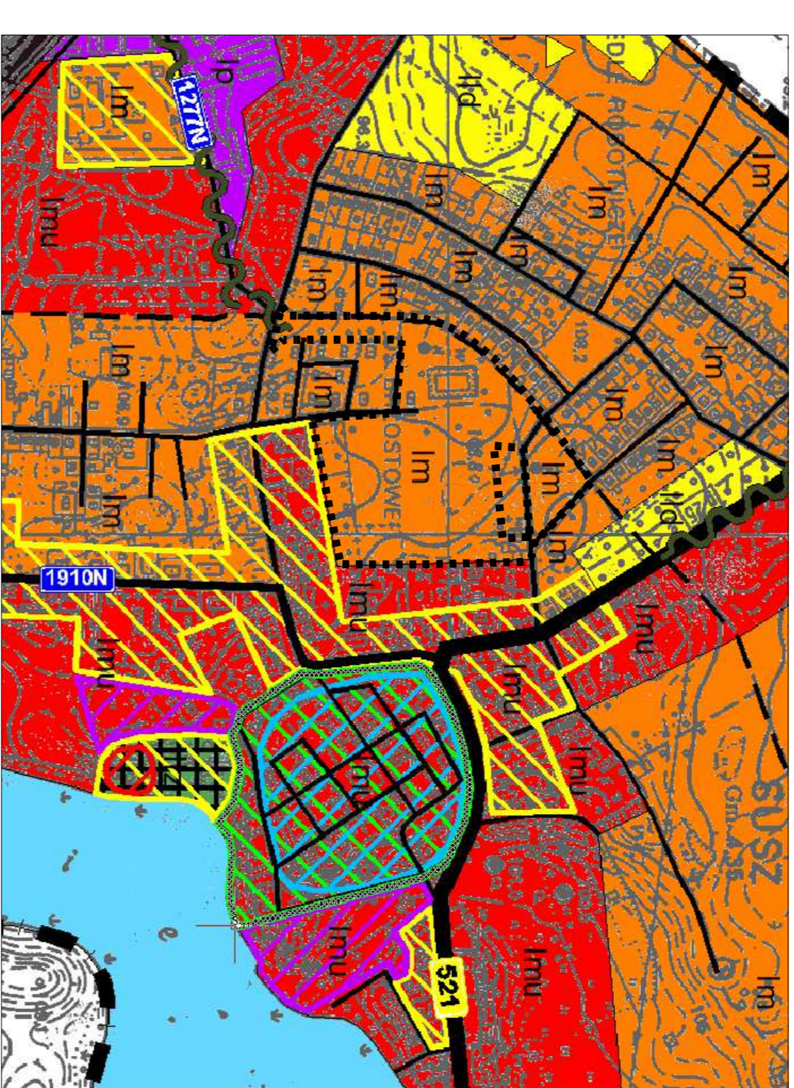
WRYs ZE STUDIUM UWARUNKOWAŃ I KIERUNKÓW ZAGospodarowania Przestrzennego