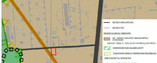
WYRYS ZE STUDYUM UWARUNKWAŃ I KIERUNKÓW ZAGOSPODAROWANIA PRZESTRZENNEGO GMINY PRAŻMÓW