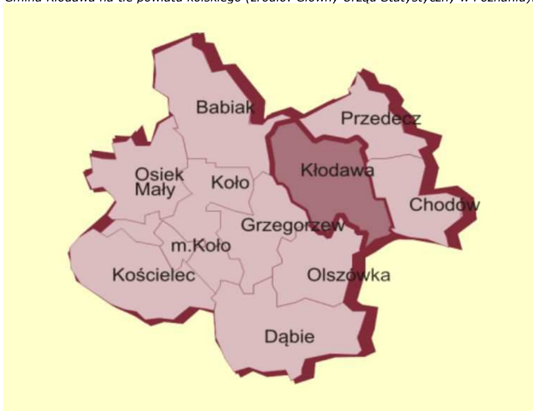
Ryc.1. Gmina Kłodawa na tle powiatu kolskiego.

Przez gminę, w tym miasto Kłodawa, przebiega droga krajowa nr 92, która zapewnia dogodne połączenie z Warszawą i Poznaniem. Jednocześnie jest to międzynarodowa trasa relacji Moskwa – Berlin. Gmina posiada połączenie z autostradą A2 relacji Świecko – Warszawa, która przebiega w odległości ok. 20 km na południe. Gminę przecina linia kolejowa Berlin – Warszawa ze stacją w Pomarzanach Fabrycznych, natomiast od strony zachodniej z gminą sąsiaduje linia kolejowa Gdańsk – Katowice.